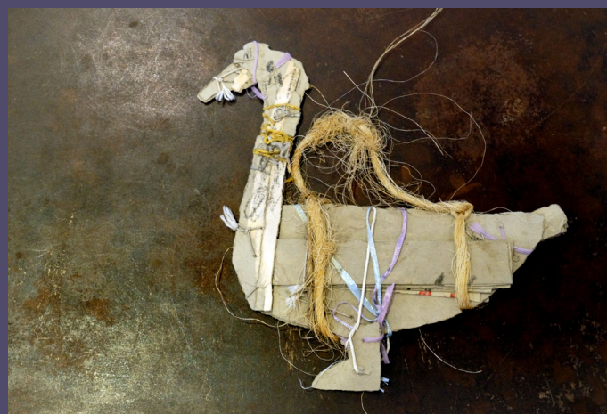
Une construction de Castle, faite de matériaux récupérés