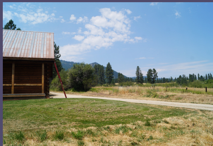
Lieu de naissance, Garden Valley, Idaho