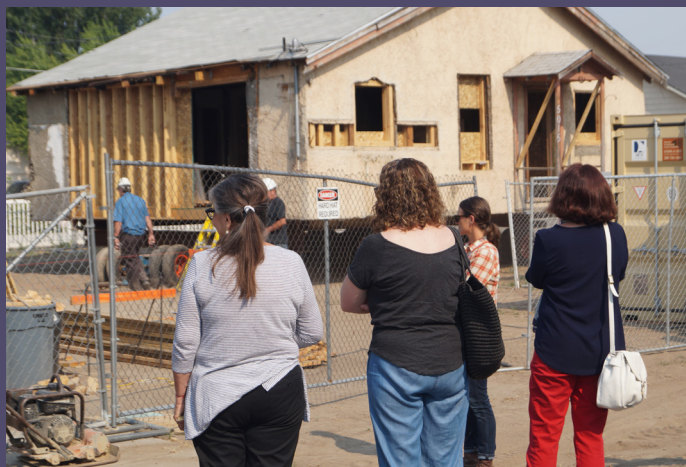
L'âge adulte, Maison de Boise, Idaho